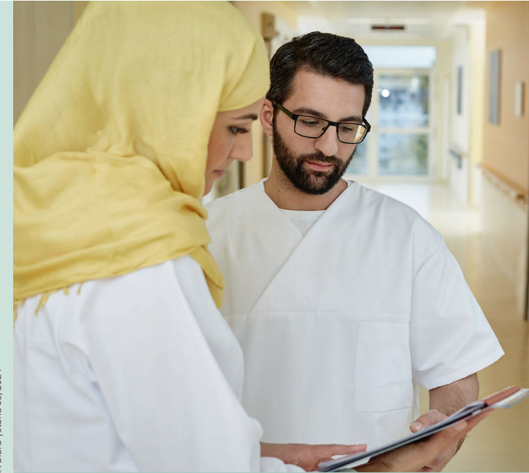
Herausgeber: BiBiG | Stand 05/2024

www.netzwerk-iq.de www.iq-nrw-west.de/bibig